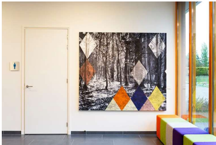
'Right Here' van Jeppe Lauge, olieverf, pastel en houtskool op doek. Crematorium Leiden.

Jeppe Lauge doorliep de Gerrit Rietveld Academie en woont en werkt sinds 2008 in Amsterdam. Hij is geïnspireerd door die stad, maar ook door Jutland met zijn bossen, velden en meren. 'Natuur past als thema al snel bij ons, omdat het rustgevend is', zegt Anneke van Eeuwijk. 'Maar dit is bovendien een spannend beeld. Wat doen die bomen op een discovloer?' Het is een van de jongste aankopen, samen met nog enkele andere werken van Lauge voor het crematorium van Leiden. 'Met iedere toevoeging in de collectie willen we iets meer durven. Dit werk sloeg meteen in als een bom. Iedereen is er dol op.'