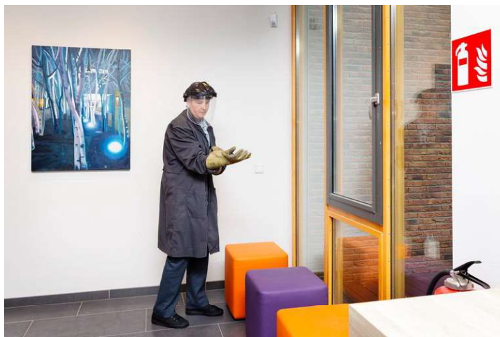
'Bankside Birches 2' van Hans Vandekerckhove aan de muur van de 'invoerruimte' van het crematorium in Leiden. Rechts een ovenist, een medewerker die de oven bedient.

Waar: Crematorium en uitvaartcentrum Rhijnhof, Leiden