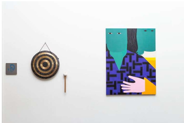
Een van de 'Tronies' van Anuli Croon bij Dela in Nijmegen.

De rode draad: reflectie, troost, doorgeven. 'De werken moeten geen aanstoot geven of afleiden, maar ze mogen wel een beetje schuren', zegt Doeve. 'Als mensen er iets van vinden en het een gesprek op gang brengt, dan is het goed. Dan is het gezien. Ze hoeven het niet mooi te vinden.' Zeker qua kleur mogen de werken iets plezierigs hebben. 'Dat je er een fijne zucht bij laat. Dat geeft het geheel bovendien meer cachet dan pastelkleurige landschapjes in oplage met een passe-partout.'